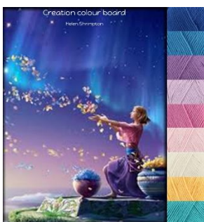
Stylecraft Classique 100% cotton Dk-4mm-G hook Greek Blue, Lavender, Fondant, Shell Pink, Sunflower Lapis, Wisteria, Azure, Ivory.

Celles et ceux parmi vous qui suivent mon groupe Facebook connaissent déjà les planches de couleurs. Voici les planches de couleurs que j'ai utilisées comme inspiration pour la création les troussees officielles de fils.