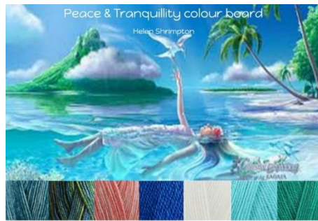
Stylecraft Batik Teal, Krypton , Coral Stylecraft Life Dk French Blue, White, Aqua, Ivy 20% wool - 80% Acrylic 4mm G hook