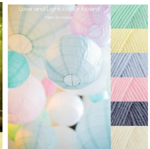
Stylecraft Baby Aran 5 mm hook Baby Mint, Baby Lemon, Baby Blue, Baby Pink, Baby Denim, Baby Cream