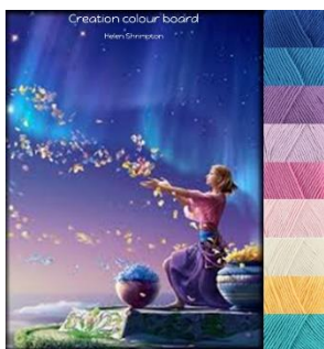
Stylecraft Classique 100% cotton Dk-4mm-G hook Greek Blue, Lavender, Fondant, Shell Pink, Sunflower Lapis, Wisteria, Azure, Ivory.