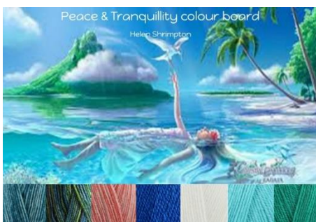
Stylecraft Batik Teal, Krypton, Coral Stylecraft Life Dk French Blue, White, Aqua, Ivy 20% wool - 80% Acrylic 4mm G hook