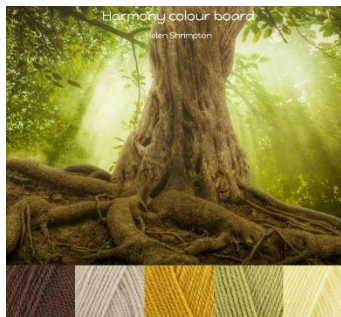
Stylecraft Special Dk-4mm-G hook Walnut, Parchment, Mustard, Lemon, Pistachio