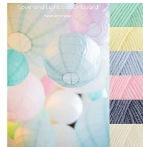
Stylecraft Baby Aran 5 mm hook Baby Mint, Baby Lemon, Baby Blue, Baby Pink, Baby Denim, Baby Cream