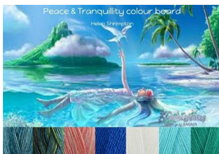
Stylecraft Batik Teal, Krypton, Coral Stylecraft Life Dk French Blue, White, Aqua, Ivy 20% wool - 80% Acrylic 4mm G hook