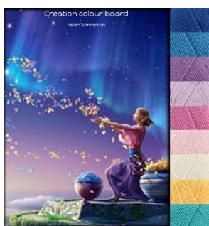
Stylecraft Classique 100% cotton Dk—4mm-G hook Greek Blue, Lavender, Fondant, Shell Pink, Sunflower Lapis, Wisteria, Azure, Ivory.

Ni som är medlemmar i min Facebookgrupp kommer att veta allt om färgskalorna. De här är mina färgskalor som jag gjort som inspiration för de officiella garnpaketen.