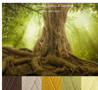
Stylecraft Special Dk—4mm-G hook Walnut, Parchment, Mustard, Lemon, Pistachio