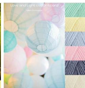
Stylecraft Baby Aran 5 mm hook Baby Mint, Baby Lemon, Baby Blue, Baby Pink, Baby Denim, Baby Cream