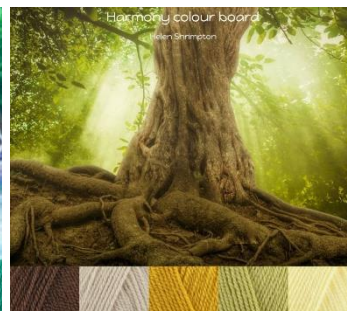
Stylecraft Special Dk-4mm-G hook Walnut, Parchment, Mustard, Lemon, Pistachio