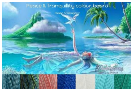
Stylecraft Batik Teal, Krypton, Coral Stylecraft Life Dk French Blue, White, Aqua, Ivy 20% wool - 80% Acrylic 4mm G hook