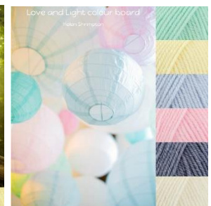
Stylecraft Baby Aran 5mm hook Baby Mint, Baby Lemon, Baby Blue, Baby Pink, Baby Denim, Baby Cream