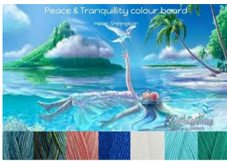
Stylecraft Batik Teal, Krypton, Coral Stylecraft Life Dk French Blue, White, Aqua, Ivy 20% wool - 80% Acrylic 4mm G hook