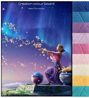
Stylecraft Classique 100% cotton Dk-4mm-G hook Greek Blue, Lavender, Fondant, Shell Pink, Sunflower Lapis, Wisteria, Azure, Ivory.