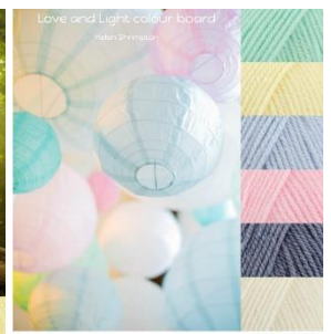
Stylecraft Baby Aran 5mm hook Baby Mint, Baby Lemon, Baby Blue, Baby Pink, Baby Denim, Baby Cream