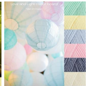
Stylecraft Baby Aran 5 mm hook Baby Mint, Baby Lemon, Baby Blue, Baby Pink, Baby Denim, Baby Cream