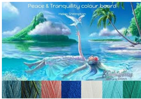
Stylecraft Batik Teal, Krypton, Coral Stylecraft Life Dk French Blue, White, Aqua, Ivy 20% wool - 80% Acrylic 4mm G hook