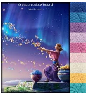
Stylecraft Classique 100% cotton Dk-4mm-G hook Greek Blue, Lavender, Fondant, Shell Pink, Sunflower Lapis, Wisteria, Azure, Ivory.