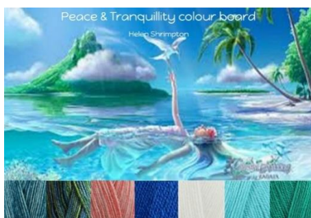
Stylecraft Batik Teal, Krypton, Coral Stylecraft Life Dk French Blue, White, Aqua, Ivy 20% wool - 80% Acrylic 4mm G hook