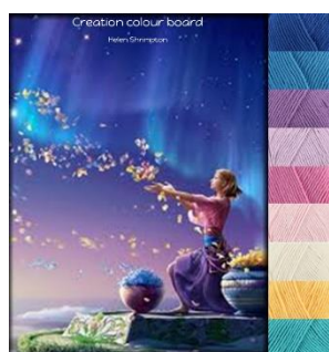
Stylecraft Classique 100% cotton Dk-4mm-G hook Greek Blue, Lavender, Fondant, Shell Pink, Sunflower Lapis, Wisteria, Azure, Ivory.

אלו מכם שהם חברים בקבוצת הפייסבוק שלי יודעים הכל על לוחות צבעים, אלו לוחות הצבעים שהיוו השראה עבור ערכות הצבעים הרשמיות.