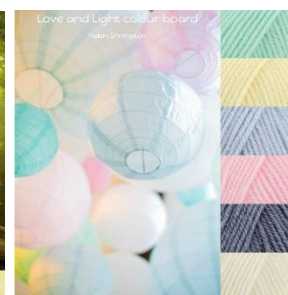
Stylecraft Baby Aran 5mm Hook Baby Mint, Baby Lemon, Baby Blue, Baby Pink, Baby Denim, Baby Cream