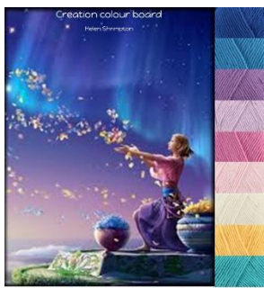
Stylecraft Classique 100% cotton Dk-4mm-G hook Greek Blue, Lavender, Fondant, Shell Pink, Sunflower Lapis, Wisteria, Azure, Ivory.