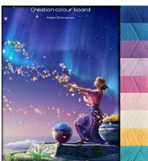
Stylecraft Classique 100% cotton Dk-4mm-G hook Greek Blue, Lavender, Fondant, Shell Pink, Sunflower Lapis, Wisteria, Azure, Ivory.

Jos kuulut Facebook-ryhmääni, tiedätkin jo kaiken värien ideatauluista. Olen suunnitellut nämä väriyhdistelmät inspiraatioksi virallisiin lankapaketteihin.