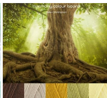
Stylecraft Special Dk-4mm-G hook Walnut, Parchment, Mustard, Lemon, Pistachio