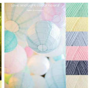
Stylecraft Baby Aran 5 mm hook Baby Mint, Baby Lemon, Baby Blue, Baby Pink, Baby Denim, Baby Cream