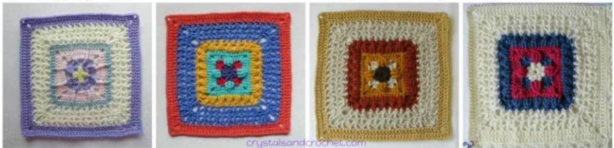
Colours per Round