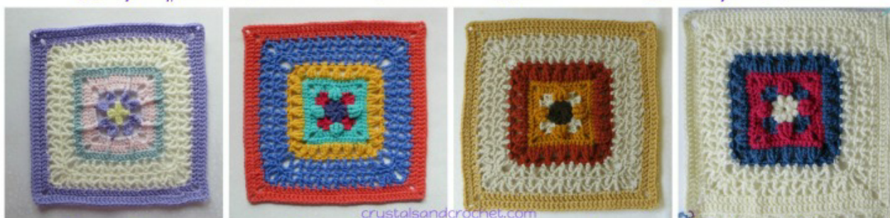
Colours per Round