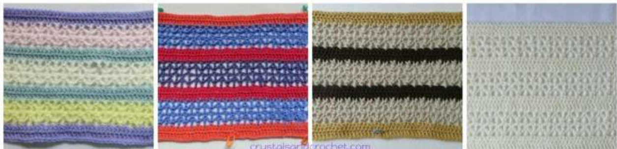
Colours per Round