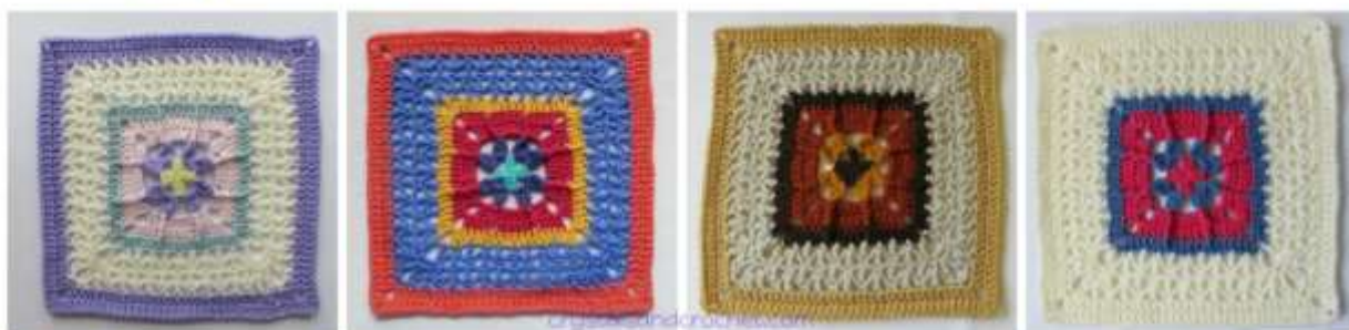
Colours per Round