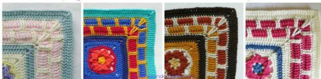
Colours per Round