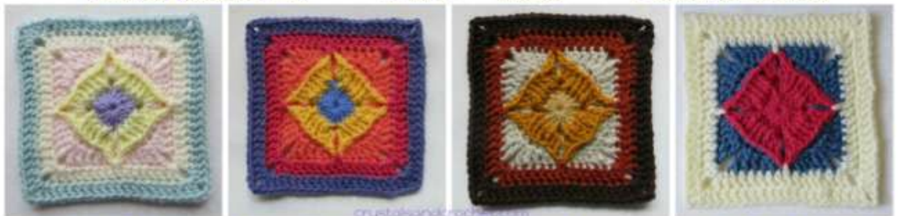
Colours per Round