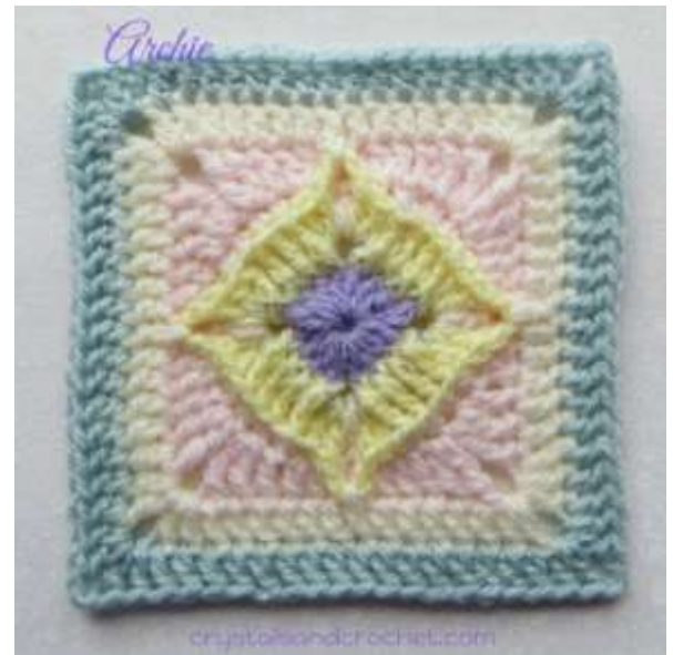
Whispers from the Past

6 duim met Aran/worsted en 5.5mm hekelpen.