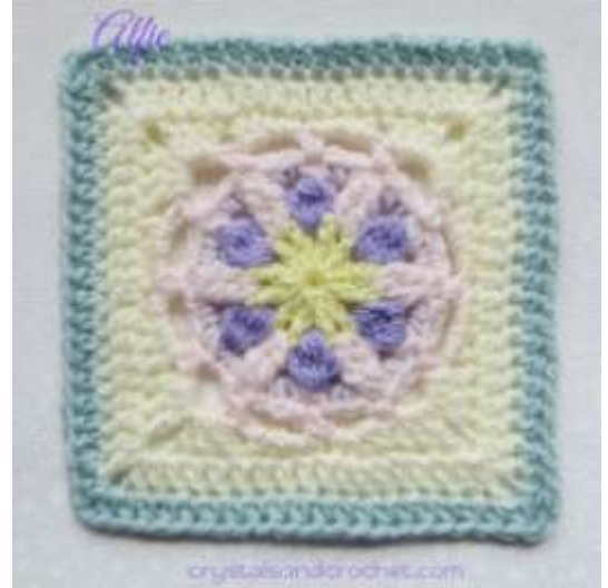
Whispers from the Past Part 3 Alfie Colours per Round

6 duim met Aran/worsted en 5.5mm hekelpen.