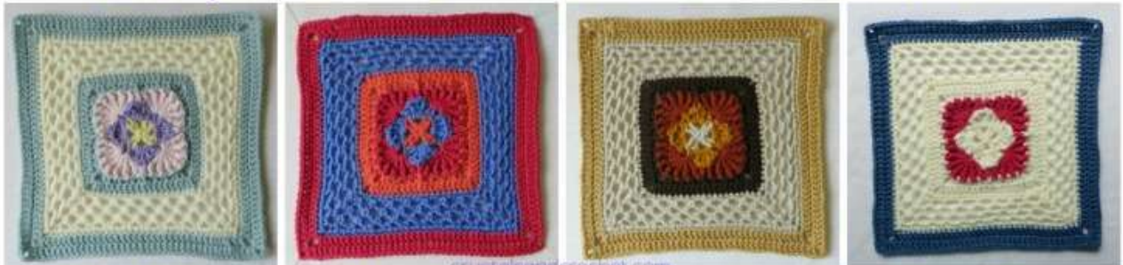
Whispers from the Past Part 1 Winnie's Flower Colours per Round