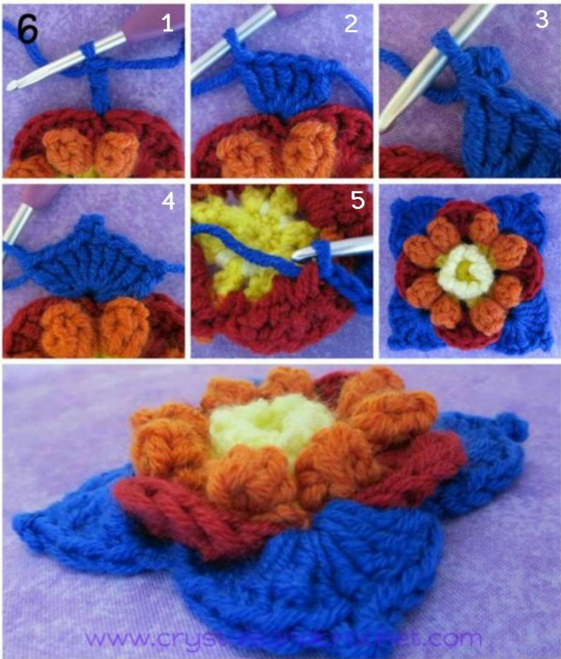
Original Design by Helen Shrimpton ♥ Copyright © 2015 ♥ All Rights Reserved.

6. להתחבר באחד מחצאי העמוד, עם עמוד כפול עומד, לסרוג עוד 4 עמודים כפולים באותה עין, 3 עיני שרשרת ועין שטוחה לראש העמוד הכפול ליצירת פיקה, [P3], לסרוג עוד 4 עמודים כפולים באותה עין, * 2 עיני שרשרת, עין שטוחה לבסיס הצדף שנסרג בשורה 5 מהצד האחורי של הסריגה [P5], 2 עיני שרשרת, בחצי עמוד הבא (5 עמודים כפולים, פיקה של 3 עיני שרשרת, 4 עמודים כפולים). * לחזור מ * עד * עוד פעמיים, 2 עיני שרשרת, עין שטוחה לבסיס הצדף שנסרג בשורה 5 מהצד האחורי של הסריגה, 2 עיני שרשרת. לחבר לעמוד הכפול העומד, לחתוך ולנעול ולאבטח קצוות. ספירת תכים: 4 קבוצות בצורת שפיץ של 9 עמודים כפולים עם פיקה [36 עמודים כפולים בסה"כ], 8 רווחים של 2 עיני שרשרת.