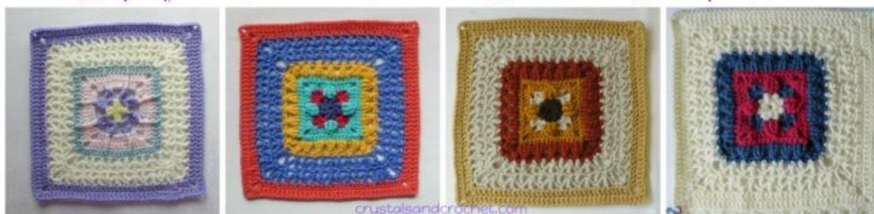
Colours per Round