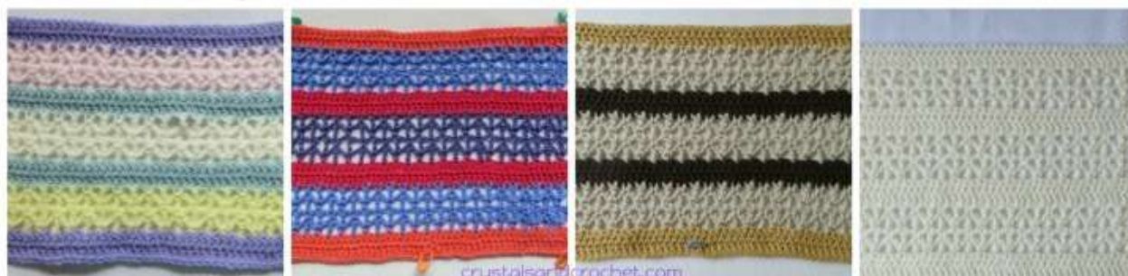
Colours per Round