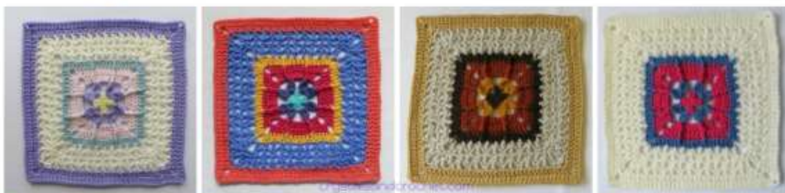
Colours per Round