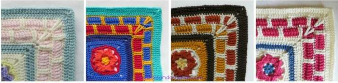
Colours per Round