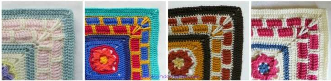
Colours per Round