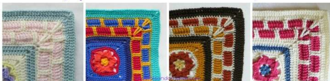
Colours per Round