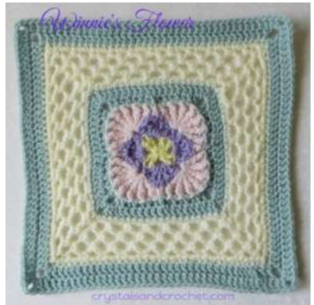
Whispers from the Past Part 1 Winnie's Flower Colours per Round