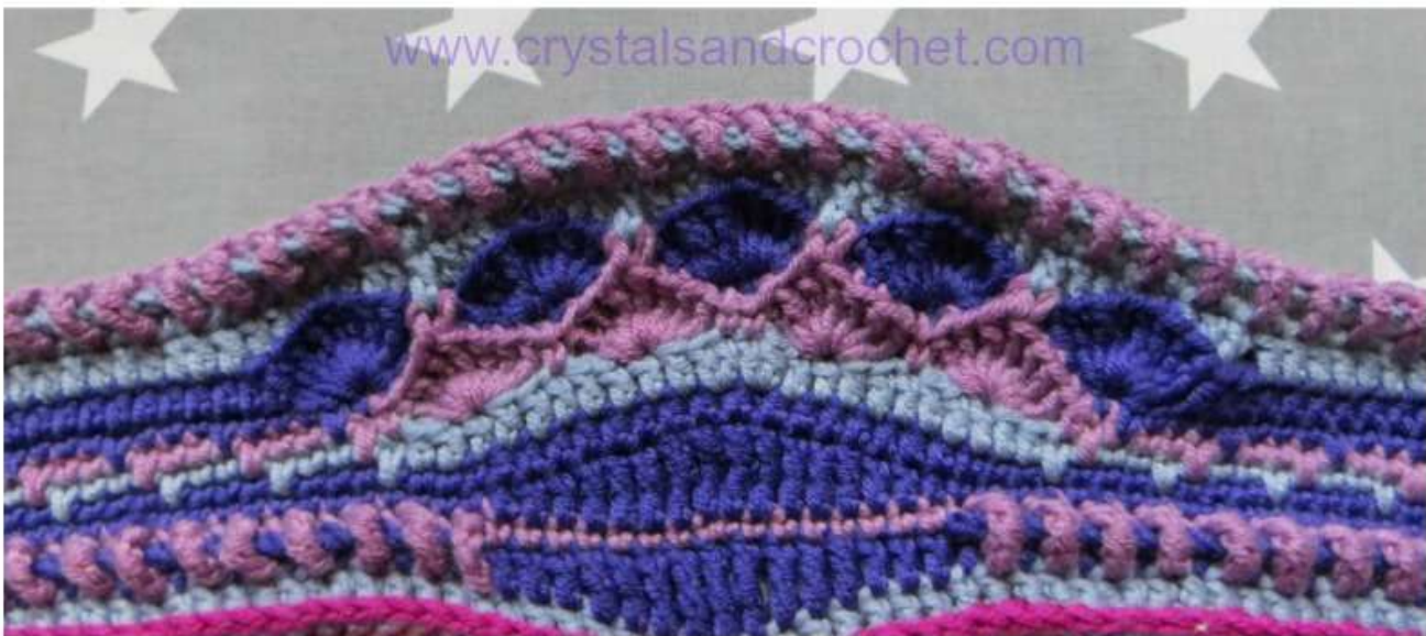
بخش 12 به پایان رسید تا هفته ی بعد .